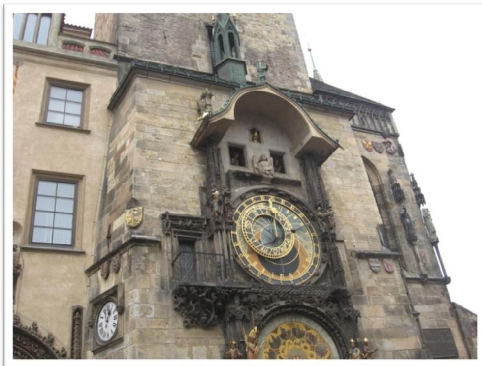
Astronomski sat u 13:00 – sa pokretnim statuama